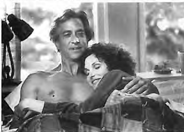
Limbo , 1999