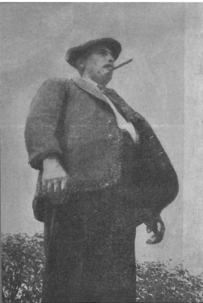
Fiesta Mayor , de Eusebio Ferrer.

propiedad para su Cinemateca circulante copias de los films; Pallás y Ribagorza , de Juan Salvans; Memórtigo , de Delmiro Caralt; El hombre importante , de Domingo Jiménez, y Folklore , de Fabra.