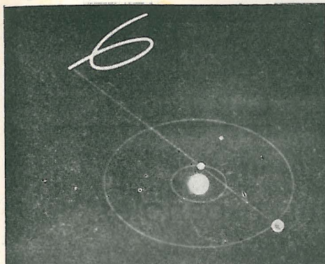
CHECOSLOVAQUIA Kopernikus , de Kurt Rupli.