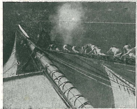
Victoria en Túnez : documental de la guerra en África.