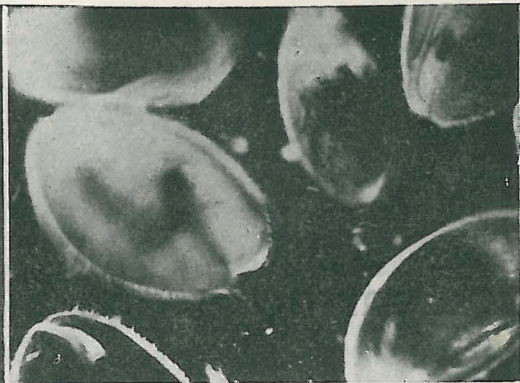
ALEMANIA Un film cultural microscópico.