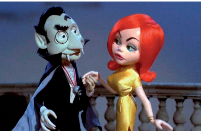
Fig. 4 – Mad Monster Party (Jules Bass, 1967)