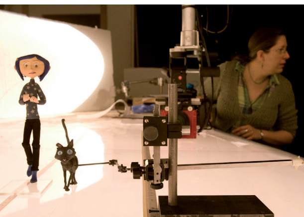
Fig. 2 – Rodando Coraline (Henry Selick, 2009)