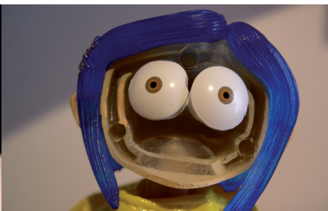
Fig. 3 – Cabeza de Coraline

incluida— estén ahora a mano para limar las aristas de lo ya de por sí asombroso (Fig. 1).