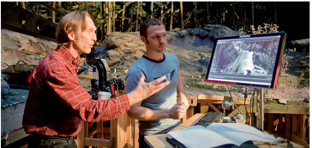
Fig. 6 – Henry Selick dirigiendo Coraline

son, Aventuras en el desván ( Na půdě aneb kdo má dneska narozeniny? , 2009) de Jiří Barta, y ¡Piratas! ( The pirates! Band of misfits , 2012) de Peter Lord. La primera de ellas prolonga, en otra dirección, el problema de autoría de Pesadilla... : es la obra sintomática de una tendencia de última hora —el capricho de muchos directores de imagen real de tener “su” película animada, aunque, por supuesto, no la animen ellos, en una evolución sofisticada de las subcontratas del Animagic de Rankin/Bass—. Anderson, como Richard Linklater, Fernando Trueba, Patrice Leconte, Juan José Campanella y Luc Besson, entre otros, logra con Fantástico Sr. Fox tener, así, su excursión particular al universo animado, aunque con una diferencia sustancial: la estética sumamente estilizada y la férrea codificación de la puesta en escena en su cine de imagen real convierten este proyecto en una prolongación natural de todo su discurso creativo, plasmado en una cinta animada que, como tal, es una anomalía, una disfuncionalidad —pues uno de sus referentes es el realismo anti-antropomórfico de una película tan extraña y valiosa como Orejas largas ( Watership Down , 1978) de Martin Rosen—. El proyecto de Anderson también produce una interesante paradoja: si los actores de