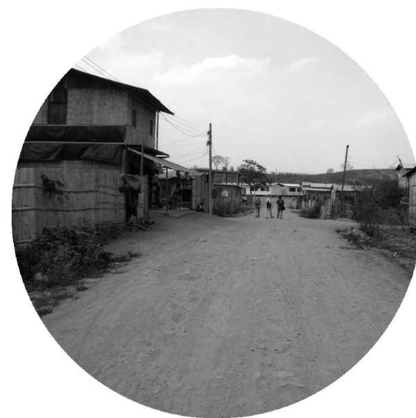
2012 suburbios del noroeste