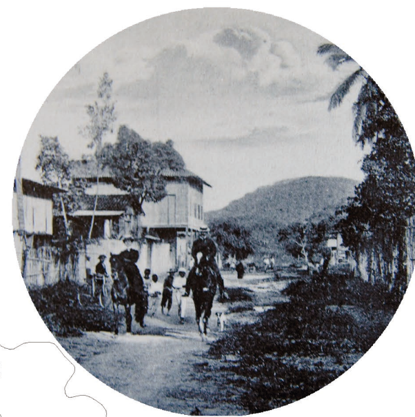
1970 Suburbios del sur