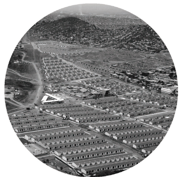
2013 Socio vivienda