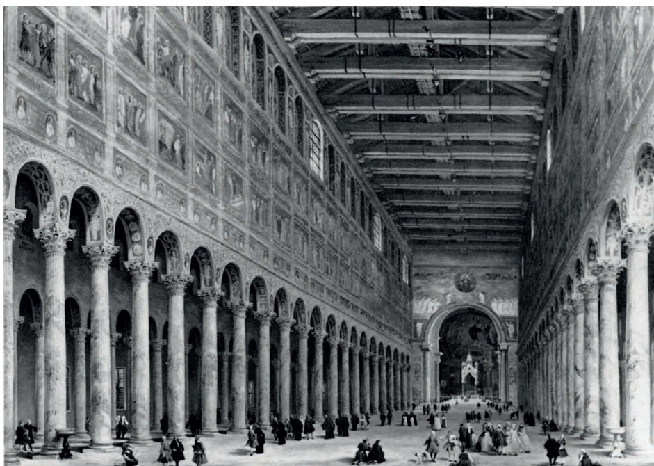
4. G.P. Panini, Interno di S. Paolo fuori le mura, Roma, 1741.