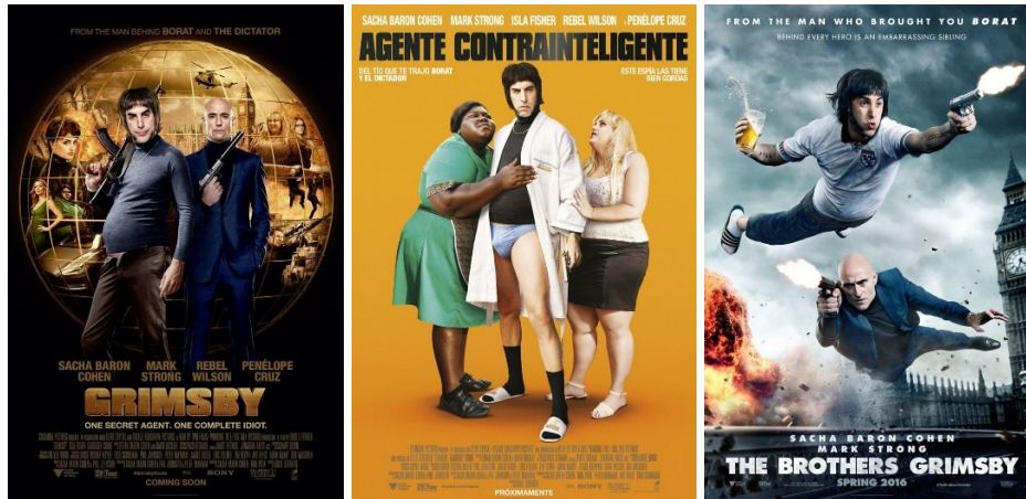
Figs. 4, 5 y 6. Tres versiones del cartel del film anglosajón "Grimbsy", para su distribución en Estados Unidos, España y Reino Unido respectivamente.

De nuevo nos quedamos sorprendidos con el cambio de estrategia que siguen los responsables de la distribución española, cuya técnica consiste en banalizar despectivamente todo aspecto interesante o sutil que pudiese haber en el original. Si bien el título original de la película era The Brothers Grimbsy , se optó por eliminar la referencia a su parentesco, reforzando así el nombre de la ciudad inglesa, y concretamente de la barriada de Cleethorpes, muy afectada por los recortes sociales y económicos durante los gobiernos conservadores de la era thatcheriana. El club de fútbol al que da nombre ( Grimbsy Town Football Club ) tiene mucho sentido en el argumento de la trama del film, en el cual además se mezclan cuestiones referidas a la adopción de uno de los hermanos, y por tanto a las diferencias sociales que les han separado en las últimas décadas. Todos estos succulentos significados quedan reducidos a la ignominia cuando vemos el título traducido al español. Pero lo peor de todo es la imagen con la que se ilustra el grafismo de la versión española.